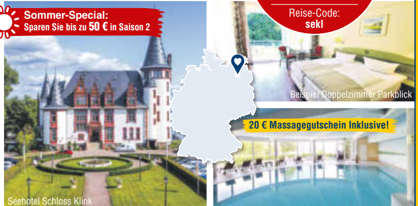
Beispiel Doppelzimmer Parkblick

Einzelzimmerzuschlag: 30 €/Nacht Kurtaxe: ca. 2 € p. P./Nacht