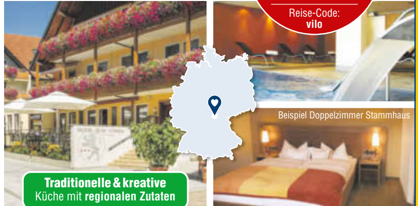
Beispiel Doppelzimmer Stammhaus

Einzelzimmerzuschlag: 20 €/Nacht Kurtaxe: ca. 2 € p. P./Nacht