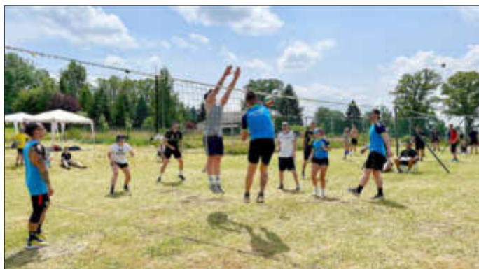
VfB Fußball (links) gegen VfB Volleyball (rechts)

Alles begann Anfang der 90-er Jahre, so ganz genau weiß es niemand mehr, an der Jugendherberge. Inspiriert von den ersten West-Verbindungen mit Volleyballern aus Oberfranken riefen Schönecker Volleyballer ein Sommer-Turnier ins Leben, das bis heute Bestand hat. Damals zog man alsbald ans Sägewerk, um mehr Kapazitäten zu erreichen, und dann weiter an den Meiler, bis die VfB-Volleyballer seit nunmehr über 15 Jahren im Ortsteil Schilbach am Dorfgemeinschaftshaus ihr perfektes Domizil gefunden haben. Die ein oder andere Unterbrechung blieb freilich nicht aus, sei es wetter- oder pandemiebedingt. Aber es geht weiter. Und so verwandelten auch dieses Jahr, traditionell am letzten Juni-Wochenende, neun Mannschaften aus dem Vogtland das Gelände wieder in ein buntes Dorffest. Zwar fehlten in Anbetracht der frühen Ferien einige Stammgäste (Leipzig, Bimos aus Adorf), aber dafür bereicherten einige Neustarter (Freizeitfüchse vom Skiclub, TSV Plauen) das Teilnehmerfeld. Nicht zu vergessen natürlich unsere Fußballer der 2. Mannschaft, die mit (oder wegen) ihrer weiblichen Unterstützung eine richtig gute Figur machten;-)