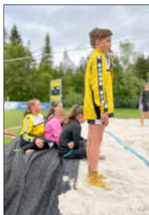
„Klein“ pfeift „Groß“

Die Nachwuchsvolleyballer standen im Mittelpunkt einer kleinen Saisonabschlussfeier am Beachplatz.