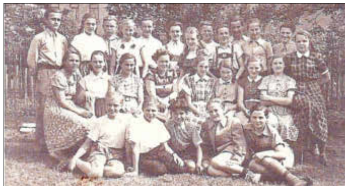
Klassenfoto Kl. 8b