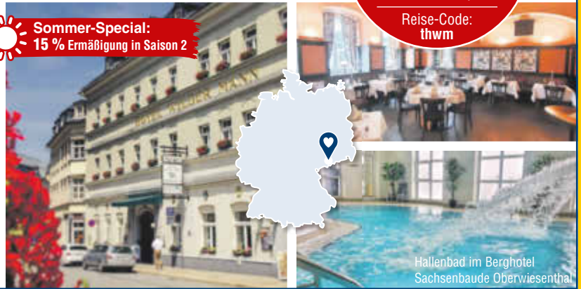
Hallenbad im Berghotel Sachsenbaude Oberwiesenthal

Einzelzimmerzuschlag: 15 €/Nacht Kurtaxe: ca. 1,80 € p. P./Nacht