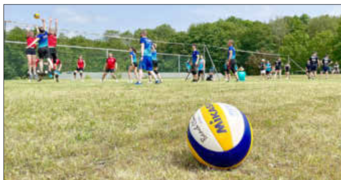
SG Werda (links in rot) gegen GK Software (rechts)